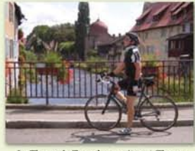
La Thur et la Tour des sorcières à Thann