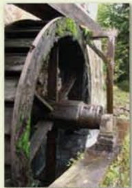
Moulin à huile de Storckensohn