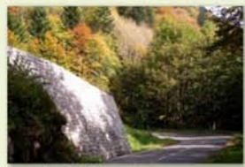
Route du col du Bramont