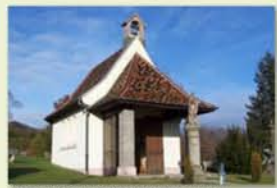
Chapelle Notre Dame à Rammersmatt