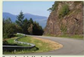
Route du col du Hundsrück