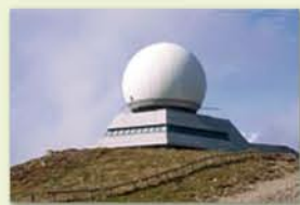
Sommet du Grand-Ballon