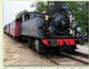
Train Touristique de la Doller