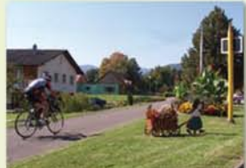
Piste cyclable à Wegscheid

La piste cyclable de la Doller vous invite à une promenade familiale sur un tracé sécurisé. Depuis la gare de Burnhaupt-le-Haut, partez à la rencontre du train de la Doller. Dès la sortie de Masevaux, la piste cyclable emprunte le tracé de l'ancienne voie ferrée de la vallée. Laissez-vous bercer par le bruit de l'eau, vivez le calme des grands espaces... La route sinueuse de Sewen vous invite à rejoindre le lac d'Alfeld pour admirer cette vallée aux mille facettes