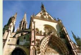
Collégiale St Thiébaud XIV - XV à Thann

Cinq kilomètres, dix ou plus, en famille ou entre amis, choisissez votre programme ! Au départ de l'Ecomusée d'Ungersheim, remontez la Thur par Cernay, passez au pied du vignoble du Rangen, pénétrez au cœur de la vieille ville de Thann. En surplomb de Saint-Amarin, admirez le défilé de la Haute Vallée de la Thur. L'itinéraire cyclable vous mène jusqu'au lac de Kruth-Wildenstein et vous propose un retour par la rive opposée via le Sée d'Urbès.