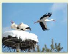
Parc à cigognes de Cernay