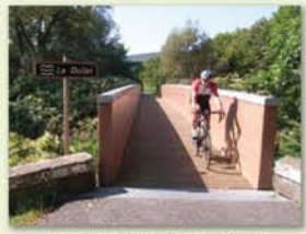
Traversée de la Doller à Sentheim