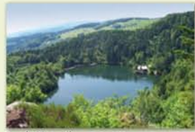
Lac du Neuweiher