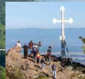
CROIX DES ENGAGÉS VOLONTAIRES D'ALSACE LORRAINE CROSS OF ALSACE-LORRAINE VOLUNTEERS