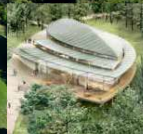
HISTORIAL FRANCO-ALLEMAND DE LA GRANDE GUERRE FRANCO-GERMAN HISTORIAL OF WORLD WAR I