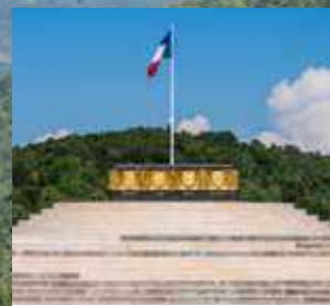
ESPLANADE ET AUTEL DE LA PATRIE ESPLANADE AND ALTAR OF THE HOMELAND