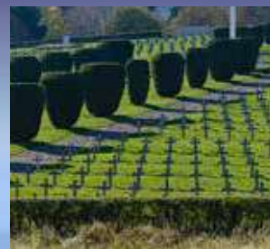
NÉCROPLE NATIONALE NATIONAL NECROPOLIS