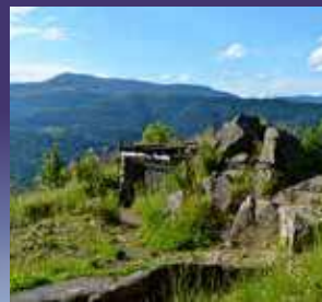
ROCHE SERMET SERMET PEAK