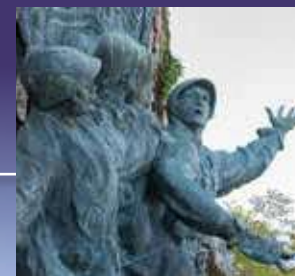
MONUMENT DU 152 nd IR MONUMENT OF THE 152 nd IR