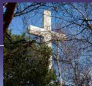
CROIX DE LA PAIX EN EUROPE CROSS OF PEACE IN EUROPE