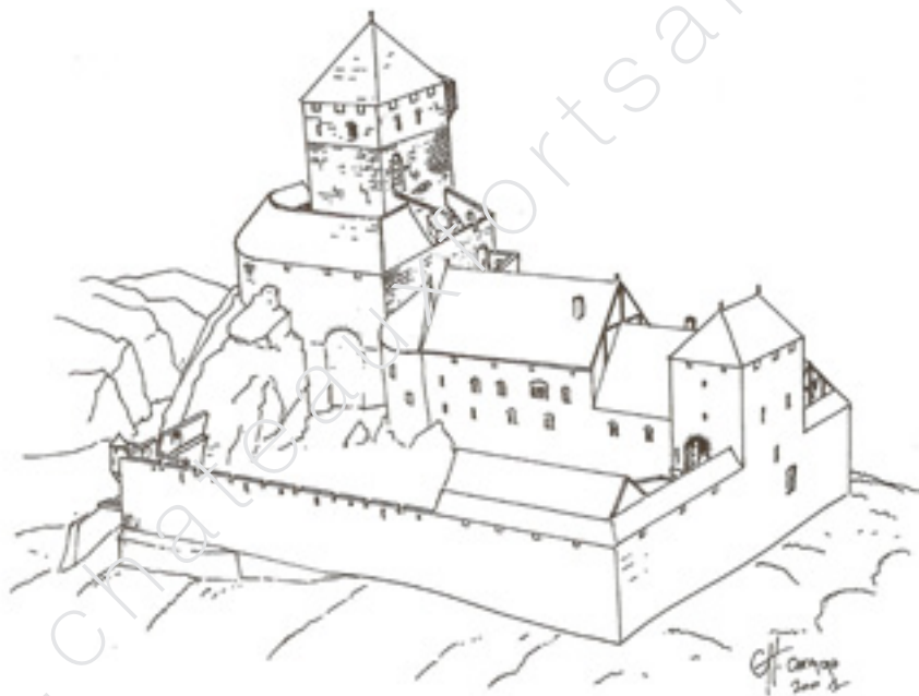
Vue idéale du Bilstein-Aubure par Christophe Carmona.

En 1217, le prévôt Mathieu, frère du duc de Lorraine et assassin de l'évêque de Toul, trouve refuge au Bilstein, alors possédé par les sires de Horbourg ; c'est la première fois qu'est mentionné ce château qui occupe l'extrémité de la côte du Schlossberg, à 757 mètres d'altitude. En 1324, le château – fief du duché de Lorraine – passe au comte Ulrich de Wurtemberg. Dans les années 1470, des travaux d'entretien y sont réalisés, avec notamment la pose de nouvelles tuiles fabriquées à Riquewihr, puis à nouveau en 1546. L'année suivante, les troupes de Charles Quint, en guerre contre les protestants, assiègent en vain le château. La place est toujours entretenue jusqu'à ce que, pendant la guerre de Trente Ans (1618-1648), les Suédois s'en emparent par surprise et l'incendient en 1636. Pourtant, un bailli (agent d'administration seigneuriale) y réside jusque dans les années 1670. Bilstein est ensuite laissé à l'abandon. Une zone de carrière de grès des Vosges, ayant alimenté le chantier du Bilstein, a été identifiée au sud-ouest du château, au lieu-dit Koenigstuhl.