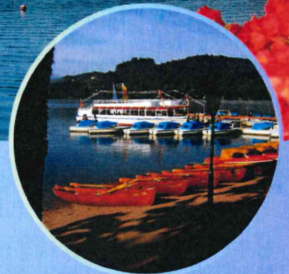
Temps libre au bord du lac