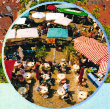
Viste guidée de la ville Rallye découverte (7/15 ans)