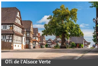
OTI de l'Alsace Verte

Am Ortseingang von Hoffen biegen Sie links in die rue du Stade ein und fahren weiter auf der rue des Églises und dann auf der rue du Tilleul (D752). An der Kreuzung biegen Sie rechts in die rue du Sable und dann erneut rechts in die rue de la Forêt ein.