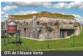
OTI de l'Alsace Verte

Folgen Sie den gelben Markierungen in Richtung Oberroedern (Kasematte Rieffel), dann Hatten (Musée de l'Abri und Kasematte von Esch) und überqueren Sie schließlich die D28, rue de la Gare in Richtung Rittershoffen.