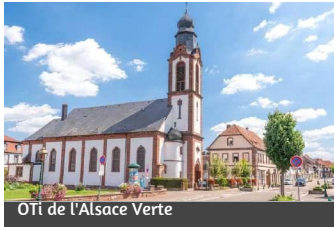
OTI de l'Alsace Verte

Von der rue des Barons de Fleckenstein aus erreichen Sie die rue du Docteur Michel Deutsch und die rue de Seltz. Am Kreisverkehr gehen Sie geradeaus weiter auf der D28. Sie überqueren die D263 und gehen weiter bis zum Dorf Hohwiller.