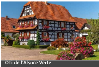
OTI de l'Alsace Verte

Sie erreichen das Dorf über die Hauptstraße, fahren an der Kirche Saint-Jean-Baptiste vorbei und biegen dann in die dritte Straße links, die rue de Hoffen, ein.