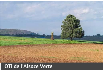
OTi de l'Alsace Verte

Das Sandsteinmonument wurde zu Ehren der schlesischen Jäger des 5. preußischen Korps errichtet, denen es gelang, eine französische Kanone zu erbeuten, die sich an dieser Stelle befand. Dieses Artilleriegeschütz, das aufgrund eines gebrochenen Rades bewegungsunfähig war, war das einzige der Division Douay, das während der Schlacht erbeutet wurde.