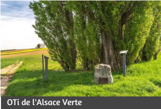
OTi de l'Alsace Verte

Der Gedenkstein befindet sich an der Stelle, an der General Abel Douay am 4. August 1870 durch einen Granatsplitter tödlich verwundet wurde. Er befehligte die 2. Infanteriedivision des 5. Rhein-Armeekorps unter dem Kommando von Marschall Mac Mahon. Das Denkmal und das Grab von Abel Douay befinden sich auf dem Friedhof von Wissembourg.