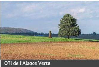
OTi de l'Alsace Verte

Le monument en grès a été érigé en l'honneur des chasseurs de Silésie du Vème corps prussien dont une compagnie est parvenue à s'emparer d'un canon français se trouvant à cet emplacement. Cette pièce d'artillerie, immobilisée en raison d'une roue brisée, fut la seule de la division Douay à être prise durant la bataille.