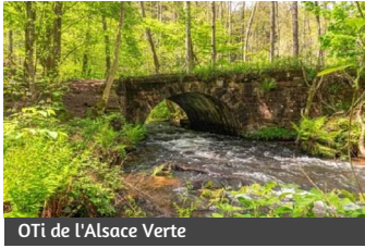
OTi de l'Alsace Verte

Lieu : Près du pont, en amont de Lembach