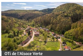
OTi de l'Alsace Verte

Lieu : parking au nord de l'étang du Fleckenstein