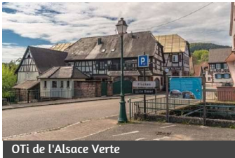
OTi de l'Alsace Verte