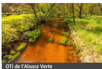
OTi de l'Alsace Verte

Lieu : Parking au niveau du carrefour des routes départementales D925 et D3, en aval de l'étang du Fleckenstein