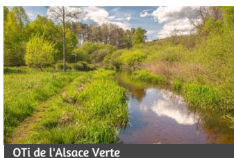
OTi de l'Alsace Verte

Lieu : Sauer, en aval de l'étang du Fleckenstein, au niveau du vieux pont en arche