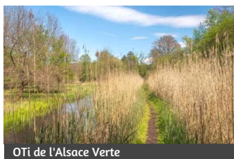
OTi de l'Alsace Verte

Localisation : La zone à roseaux dans le Königsbruch