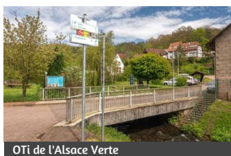
OTi de l'Alsace Verte

Lieu : en aval de Hirschthal, à proximité de la frontière