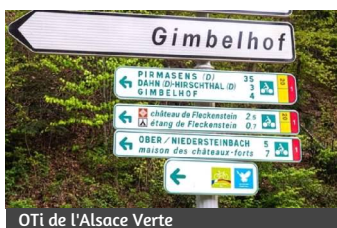
OTi de l'Alsace Verte