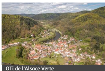
OTi de l'Alsace Verte

Localisation : Camping Königsweiher, Schönau, pont