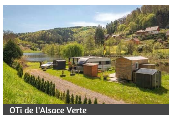
OTi de l'Alsace Verte

Localisation : Pont dans le centre de Hirschthal