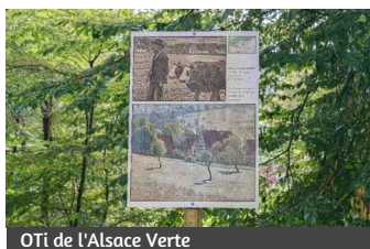
OTi de l'Alsace Verte

Il faut garder à l'esprit qu'à l'époque, de tels sujets ne sont pas considérés comme "dignes d'être peints". Le quotidien rural et ses habitants sans prétention, les paysages charmants mais peu spectaculaires, la représentation pure de la nature sans référence à un événement ou à une idée, tout cela n'a commencé à attirer l'attention des artistes plastiques que très lentement.