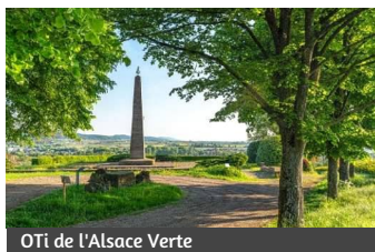
OTi de l'Alsace Verte

Cette colline du Geisberg fut le lieu de batailles successives dont la plus célèbre, la bataille du 4 août 1870, aboutit à la victoire des Prussiens sur les troupes du Général Abel Douay. Appéciez le panorama unique sur Wissembourg et le vignoble du Palatinat avant de revenir au point de départ.