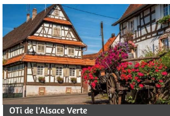
OTi de l'Alsace Verte

A proximité de la Cave Viticole de Cleebourg, 3 sentiers de randonnée pédagogique permettent de promouvoir le patrimoine naturel du territoire, le sentier viticole, le sentier arboricole et le sentier forestier.