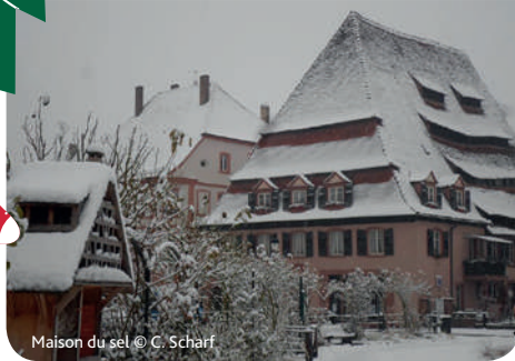
Maison du sel

Départ : Office de Tourisme, 11 place de la République, 67160 Wissembourg