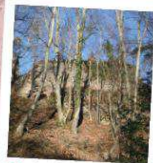
2 Le château du Schwarzenbourg