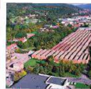
3 L'industrie textile Hartmann

Partez à l'assaut du Petit Ballon grâce à ce circuit pour les sportifs ! Vue panoramique sur la plaine d'Alsace et la Forêt Noire voisine en prime !