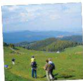
1 Le Petit Ballon

Depuis le complexe sportif, emprunter la piste cyclable en direction de Metzeral. Après le centre du village et le camping de Luttenbach en direction de Breitenbach, prendre à gauche et entamez la montée vers le Petit Ballon. C'est parti pour 20km de montée et près de 1000m de dénivelé positif ! Passage à proximité du Geisbachkopf et du Solberg. Un peu de répit au 14ème kilomètre et le passage à l'auberge du Ried. Arrivé à la ferme du Lameysberg, il reste 5km à gravir pour arriver au col du Petit Ballon en profitant d'une très belle vue sur les sommets des alentours et les villages en contrebas. Changement de versant pour la descente sur les hauteurs de Wasserbourg en passant à proximité des auberges du Strohsberg et du Boenlesgrab. Après cette dernière, environ 7km assez plats avant une petite montée pour basculer sur le village d'Eschbach-au-Val puis finir la descente vers Munster.