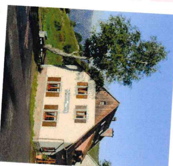
2 Ferme Auberge du Glasborn

Annexe de la commune de Hohrod, le Hohrodberg offre de magnifiques vues sur Munster. Le parcours vous mènera à proximité du Mémorial du Linge. Dans les forêts parcourues aux alentours, de nombreuses traces de la 1ère guerre mondiale marquent encore les paysages.