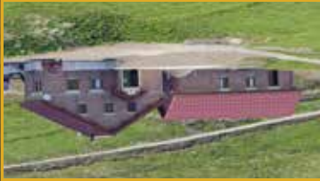
Ferme Auberge du Wissgrut