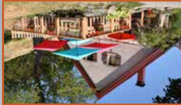
Ferme Auberge du Grand Langenberg