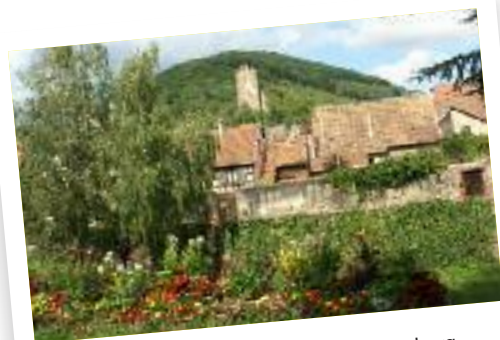
Les remparts et le château de Kaysersberg