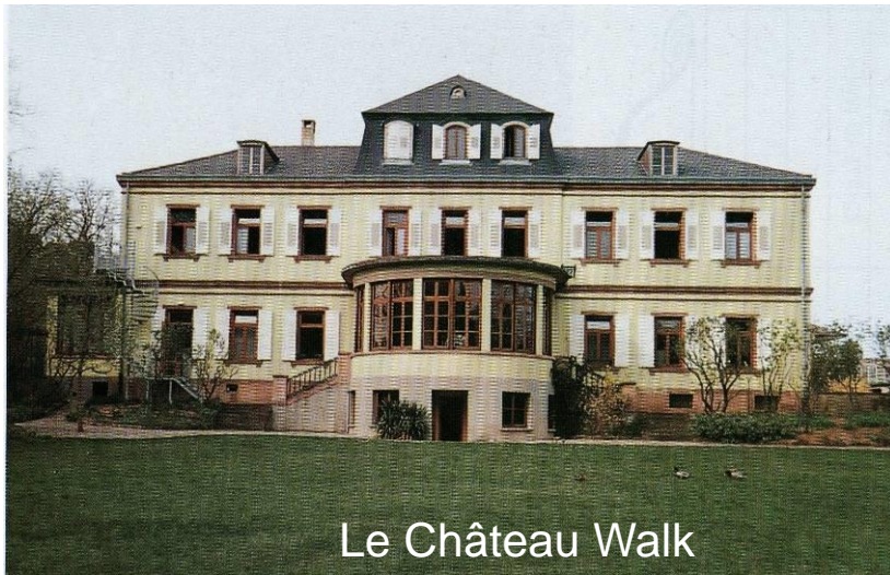
Le Château Walk