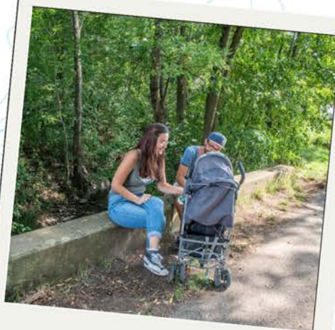
Pause au ruisseau