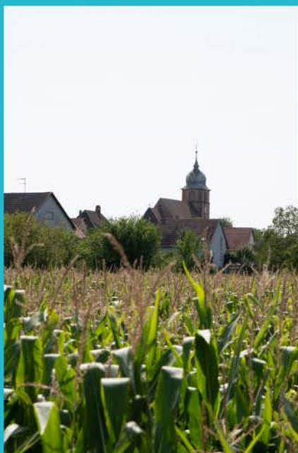
L'Église de Bergholtz