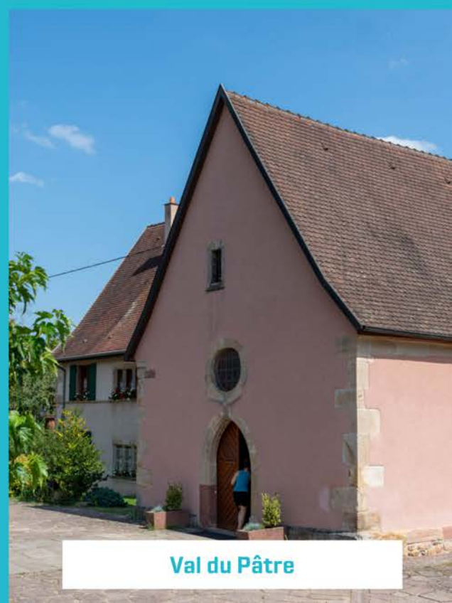
Val du Pâtre