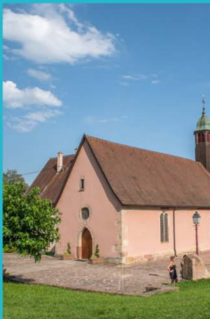
Chapelle du Schaeferthal