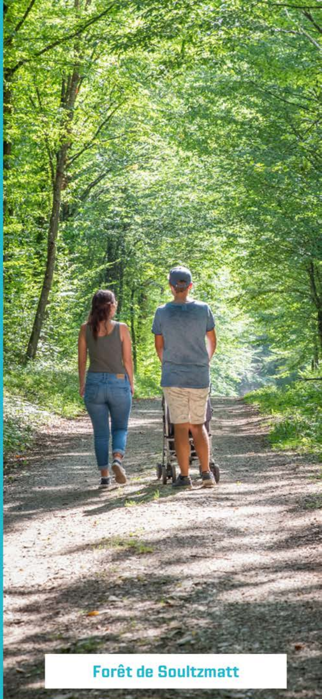
Forêt de Soultzmatt

Variante possible : Si vous souhaitez poursuivre la promenade, vous pouvez rester sur le chemin de croix jusqu'à la chapelle du Val du Pâtre (Schaeferthal). Nous vous conseillons de revenir ensuite par le même chemin et de tourner à gauche pour revenir au niveau du stade de foot.