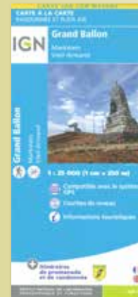
Carte 1:25 000 IGN Région de Guebwiller

Documents en vente à l'Office de Tourisme