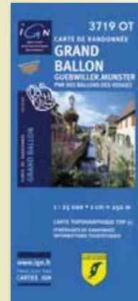
Carte IGN 3719 OT