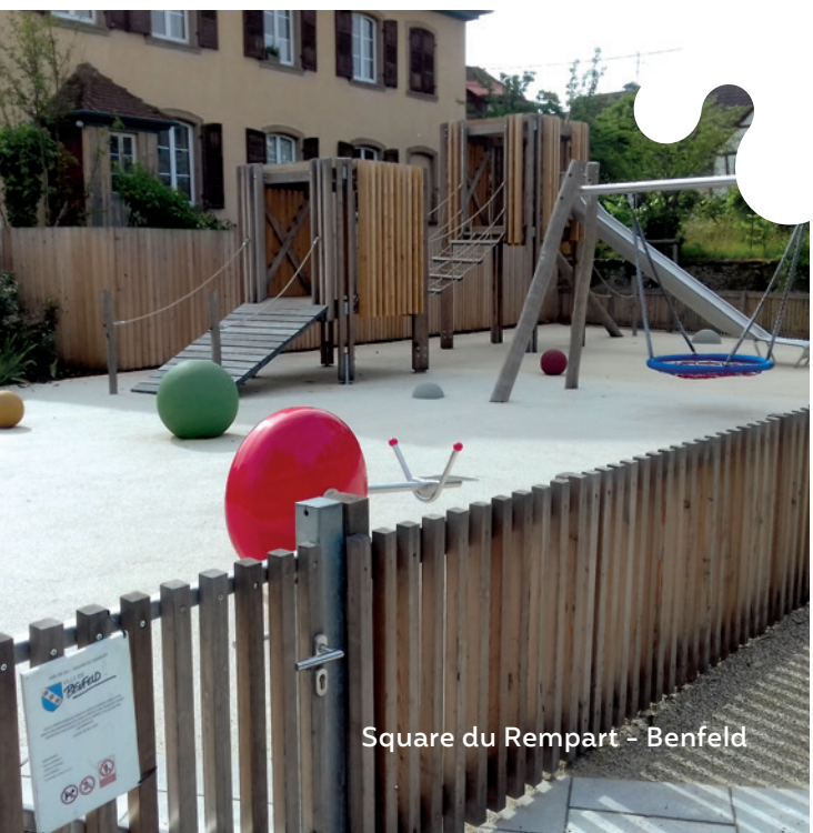
Square du Rempart - Benfeld

● « Château d'Osthouse » : C'est le dernier château de plaine d'Alsace dont les douves sont encore en activité. Le château, dont la construction de la première aile date du XV e siècle, est resté jusqu'en 1983 dans la famille Zorn De Bulach, fondatrice des lieux. Découverte du parc en été - contact OT Grand Ried. ● Au rond-point prendre à gauche vers le village. Au centre du village prendre à droite vers Gerstheim et de suite au niveau de la mairie la rue du Château à droite.