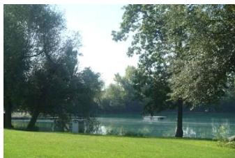
Ancienne gravière aménagée en baignade surveillée