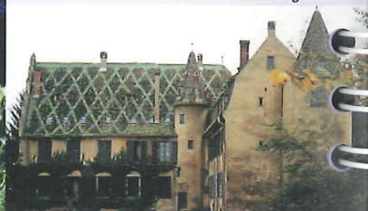
Château à douves - "Wasserburg"