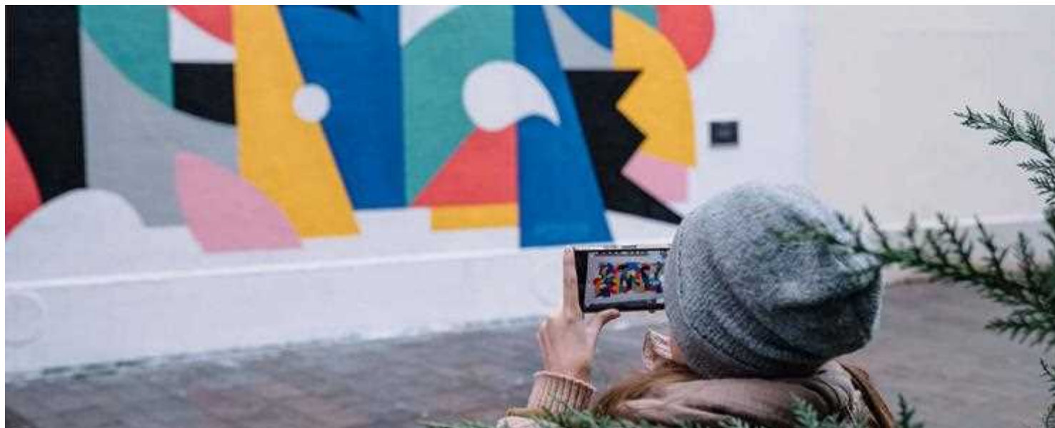
Copyright : Mulhouse Street Art © Lois Moreno - ADT