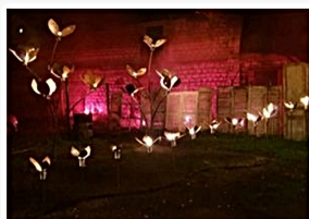
« Jardin de fer Jardin de Feu », par Mangeurs de cercle