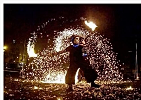
« MécanisM », par F'Art Feu Lu