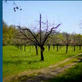
Sentier « Parcours des champs »