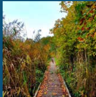
Sentier « étonnants paysages »