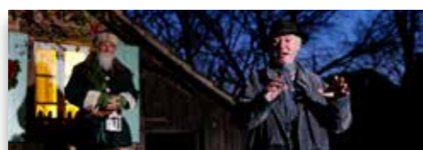
Les veillées spectacles Les 9 ; 16 ; 23 ; 26 ; 27 ; 29 et 30 déc. à 17:00