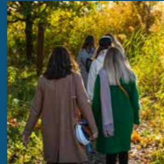
Sentier « colline sèche » 500 m.