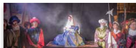
L'arrivée des Rois mages Dim. 7 janv. à 17:00