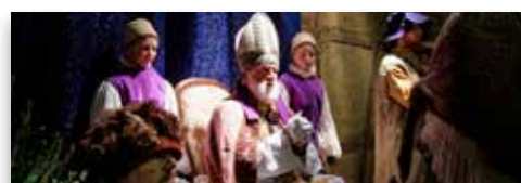
L'arrivée du saint Nicolas Dim. 3 déc. à 17:00