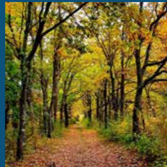
Sentier « émotions forestières » 800 m.