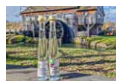
Le schnaps de l'Écomusée d'Alsace

Tous les souvenirs de votre visite à l'Écomusée d'Alsace