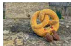
Et plein d'autres souvenirs...