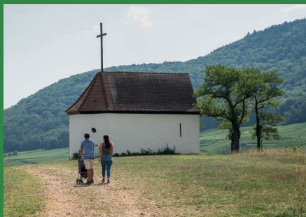
Chapelle du Bollenberg

Site à visiter : chapelle du Bollenberg (lieux mythiques), Orgue XIX e , ruines du château du Stettenberg, Château d'Orschwihr XIII au XVI e