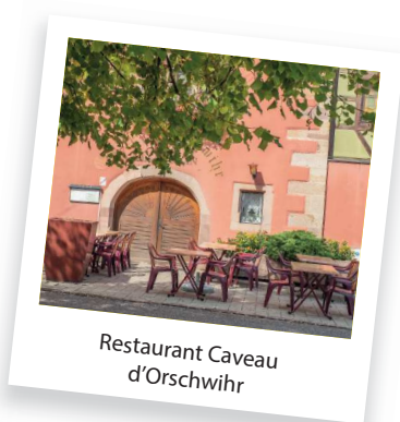
Restaurant Caveau d'Orschwihr