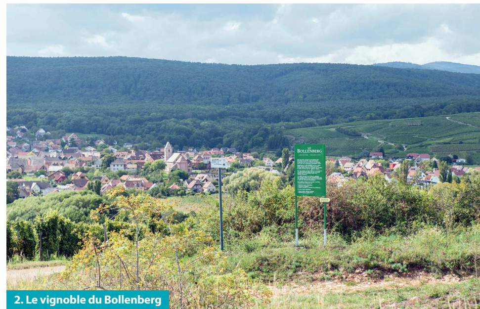
2. Le vignoble du Bollenberg