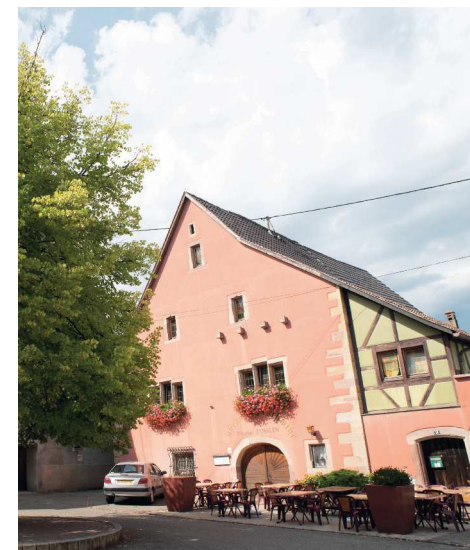
Place St Nicolas d'Orschwihr

7. Prenez la première à droite, marchez 100 m et vous êtes arrivés.