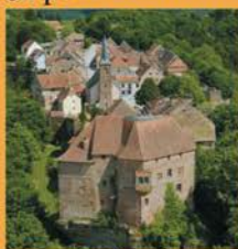
La Petite Pierre: maison du Parc

Profitez-en pour découvrir les richesses de l'Alsace Bossue