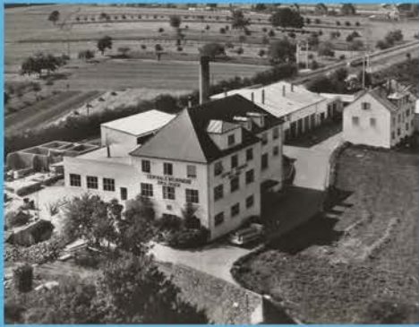
Drulingen Maison des Services (ancienne centrale beurrière)