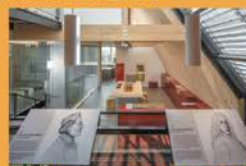
Dehlingen : CIP la Villa