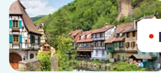
• KAYSERSBERG VIGNOBLE