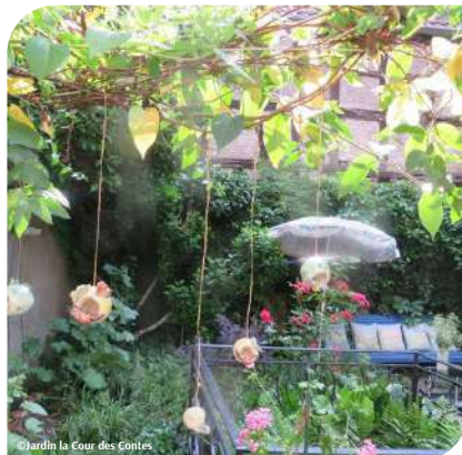
© Jardin la Cour des Contes

Cour pavée (Moyen-Âge), donc vigilance à la marche.