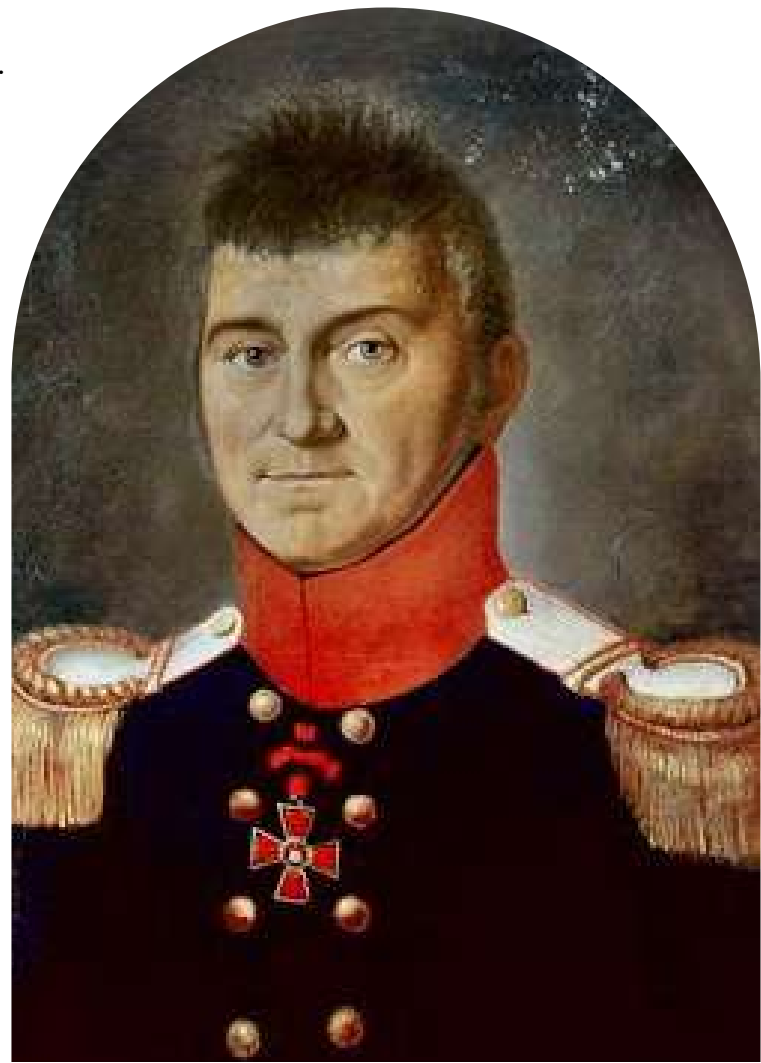
Johann Gottfried Tulla

1828 – Il décède le 27 mars 1828 à Paris des suites du paludisme. Il est enterré au cimetière de Montmartre.