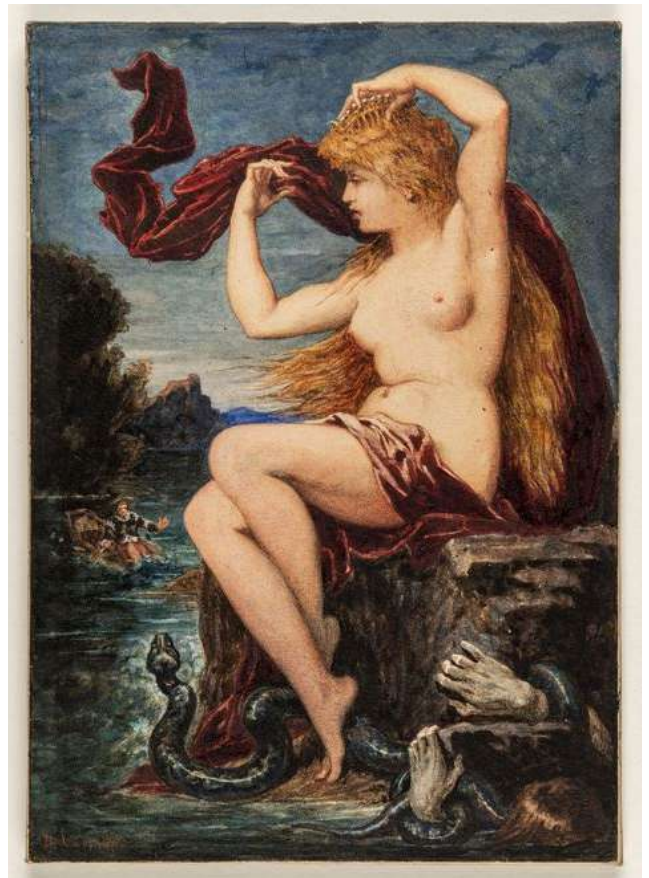
La Lorelei, fée du Rhin - Benjamin ULMANN