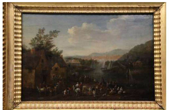
Bords du Rhin

Cabinet des estampes et des dessins de Strasbourg,