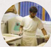
Des savoirs artisansaux