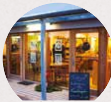
Une boutique accueillante