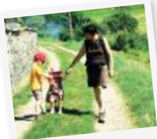
A TOUT PETITS PAS