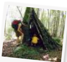
CONSTRUCTION DE CABANES