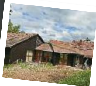
Espace apicole de Colroy-la-Roche