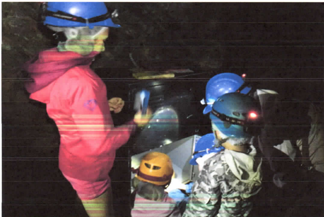
Les enfants dans l'escape room de Tellure