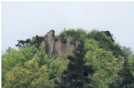
Ruines du Château d'Echery

On pourra toutefois s'approcher de la base du rocher.