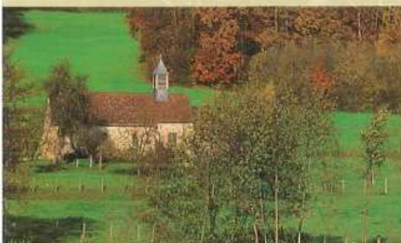
3 ↑ La Chapelle Saint-Brice