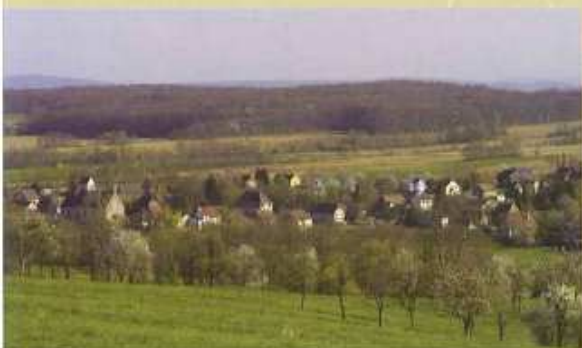
2 ↑ Hundsbach et la vallée