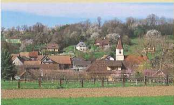
1 ↑ Le village de Franken