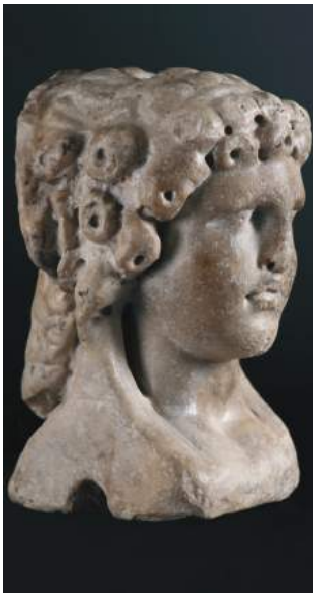
Divinité romaine Janus

La Maison de l'Archéologie bénéficie du label «Musée de France».