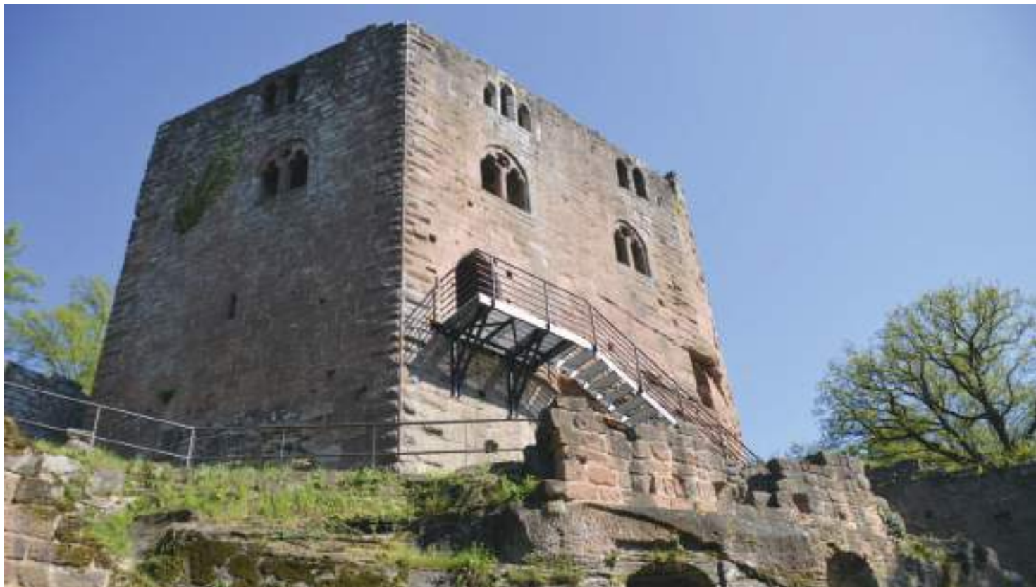
Château du Windstein

Comprendre la structure et la fonctionnalité d'un château fort des Vosges du Nord en cherchant avec un questionnaire les éléments d'architecture qui le compose.