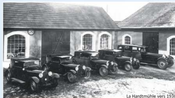
La Hardtmühle vers 1930