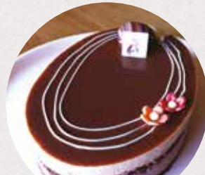
... et mêle modernité et traditions

Des moments privilégiés à réserver au +(33) 03 88 47 18 51