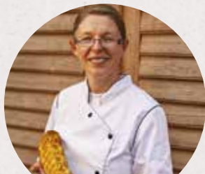
Catherine partage ses secrets...