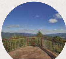
Une vue imprenable