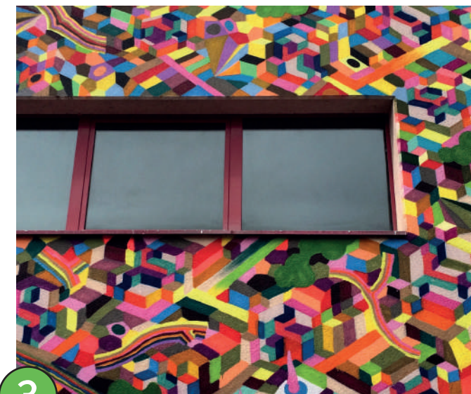
3 POPAY (FR/ES)

Retrouvez toutes les œuvres et leur localisation sur la carte interactive du Street-Art Tour mausa.fr/streetart-tour/