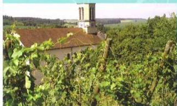
3 ↑ Le vignoble de Wittersdorf