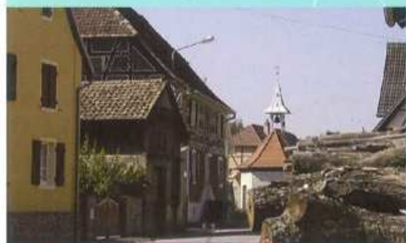
2 ↑ Emlingen, la chapelle