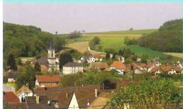
1 ↑ Panorama sur le village de Walheim