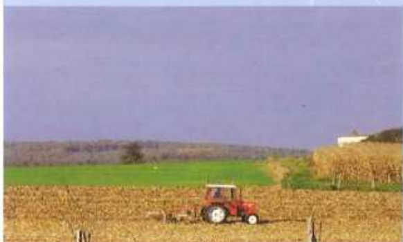
2 ↑ Vue sur le réservoir