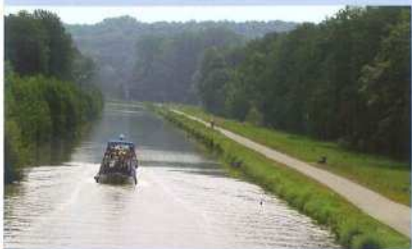
1 ↑ Le canal du Rhône-au-Rhin