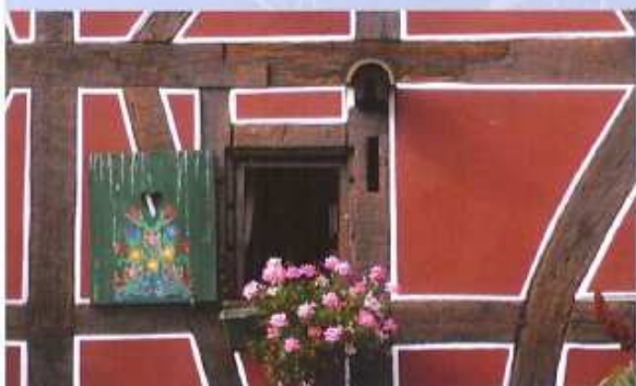
3 ↑ Maison traditionnelle à Gommersdorf