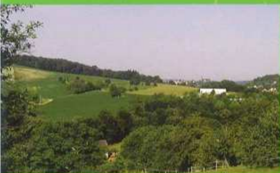
2 ↑ Point de vue vers la ferme du Schweighof et l'église Notre-Dame d'Altkirch