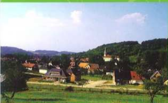
3 ↑ Point de vue vers Wittersdorf l'ancien vignoble et dans le lointain les Vosges