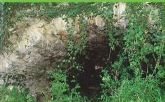
1 ↑ Winzerhauesle les vigneronns entreposaient les raisins